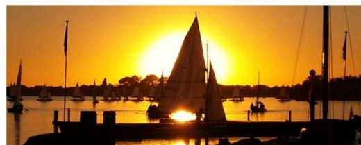
Sunset over Loosdrecht. The ultimate view.